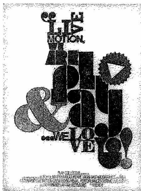
2. Poster design by ~incogburo