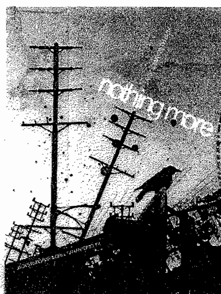
4. Poster design by =jake10684